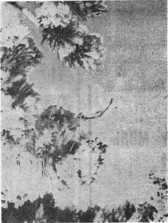
Зимние узоры. Фотоэтиюд сделан членами фотокружка Ляминской санаторно-лесной школы.

17 апреля 1918 года В. И. Ленин подписал декрет «Об организации государственных мер борьбы с огнем». Этот день принято считать днем создания советской пожарной охраны.