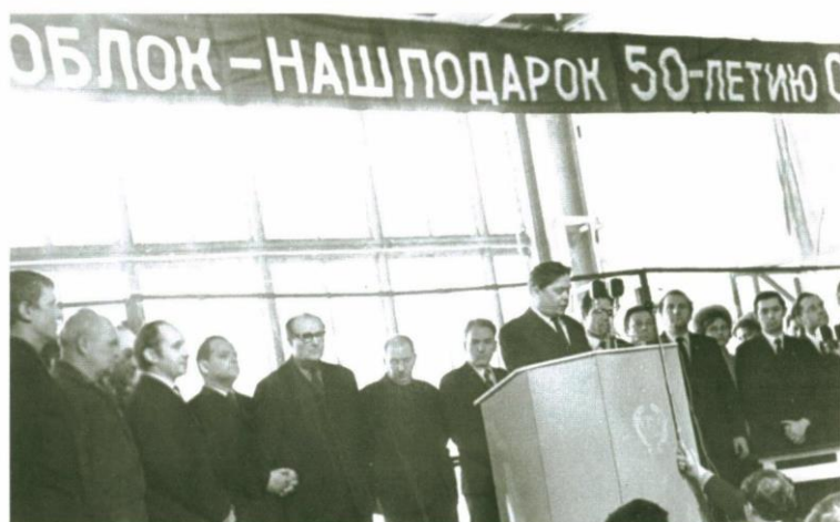
Очередной блок на строительстве ГРЭС, подарок к 50-летию СССР, 1972 г.