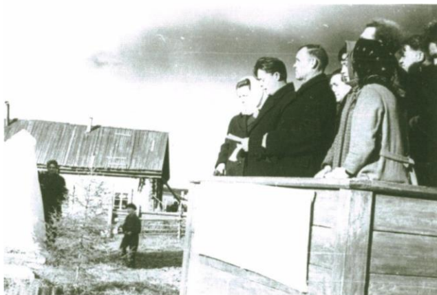
Открытие памятника погибшим за советскую власть в Тундрино

тами. Рядом с трубой накрыли праздничный стол. Это была победа всех: и сварщиков, и машинистов трубоукладчиков, и водителей трубовозов, и машинистов изоляционных комплексов, и техников, и инженеров, всего Сургута, в том числе и его партийного комитета.