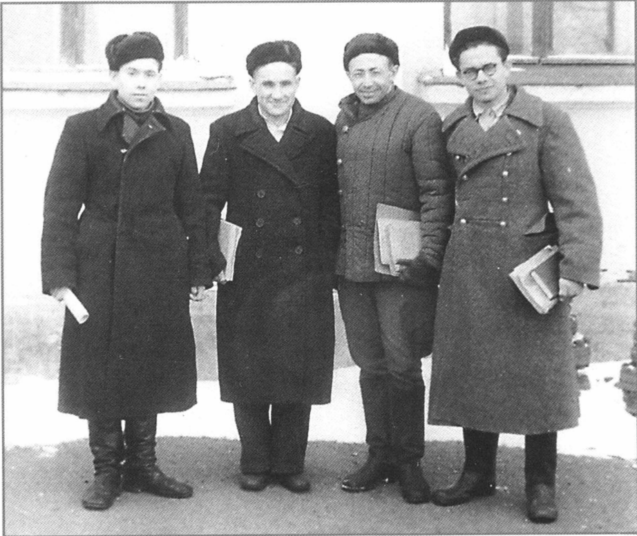
Всё ещё впереди