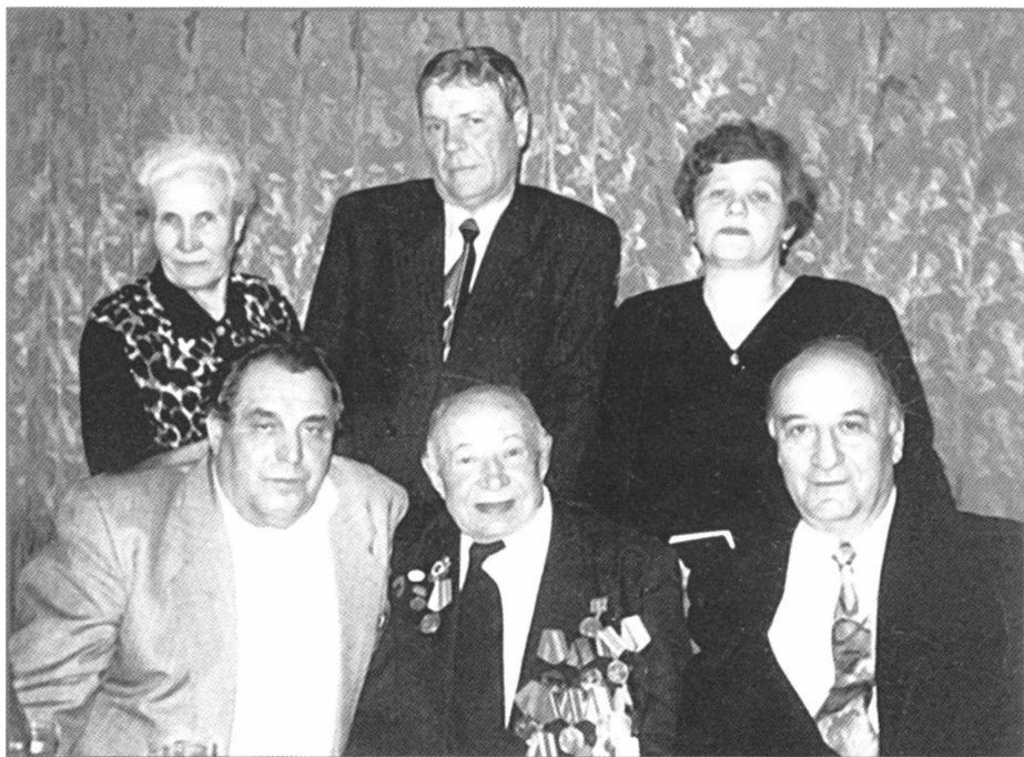
На семейном празднике