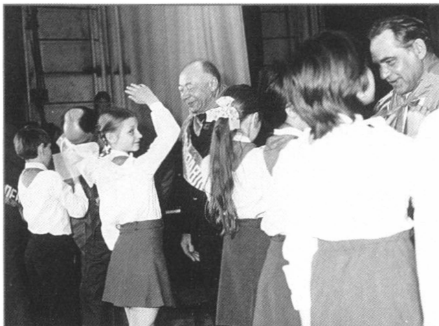
Растёт достойная смена

лопаты, которая была надёжным строительным инструментом. Всё было. Иной раз и сам становился как школьник, если говорил или делал что-то не так.