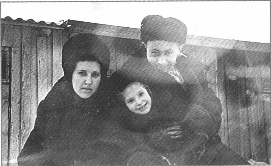
С женой и дочерью