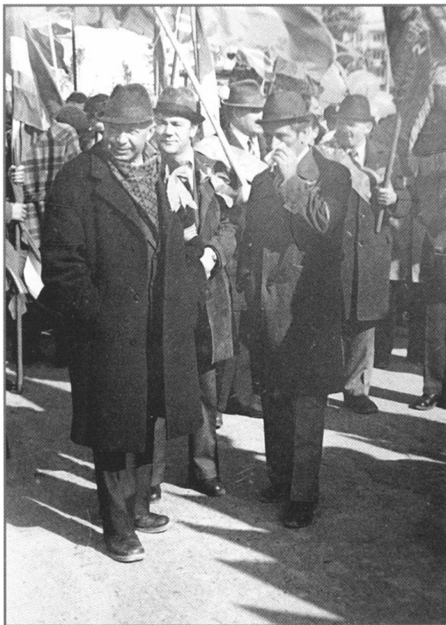
На первомайской демонстрации в колонне нефтедобытчиков