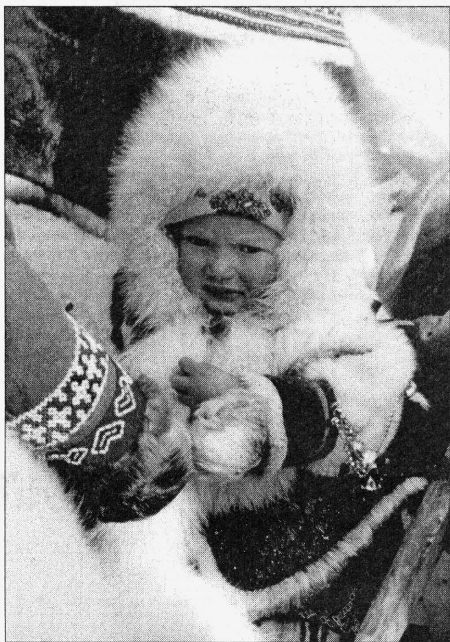
Будущее маленького народа

Мероприятия проходят в разных уголках, поэтому успеть везде и всюду, не пропустить ничего практически нереально. Сами соревнования у гостей вызывают мало внимания, за исключением, пожалуй, гонок на оленях. Соревнования по остальным видам — метание аркана и прыжки через нарды — проходят уже при малом скоплении народа: кто-то из зрителей, дождавшись финиша