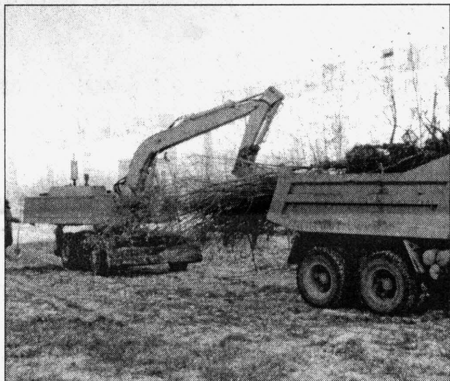
Техника должна работать

Средняя заработная плата по предприятию в 2001 году была 8894 рубля, а в 2002 году она немного снизилась и составила 8508 руб. Это официальные данные из месячных отчетов во все инстанции. Заработная плата зависит от тарифных ставок окладов и выполненных объемов работ, а тарифные ставки и оклады для муниципальных рабочих и служащих согласованы с администрацией города.