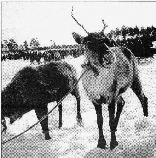
А олени — лучше!

Окончание. Начало на стр. 1. Спустя полгода глава Сургутнефтегаза с коллегами посетил Ирак и на себе испытал «прелести» американских бомбардировок. Вернувшись, Богданов стал более осторожным и посчитал, что к разговорам о перспективах разведки ближневосточных месторождений нет смысла возвращаться до снятия с Ирака санкций ООН.