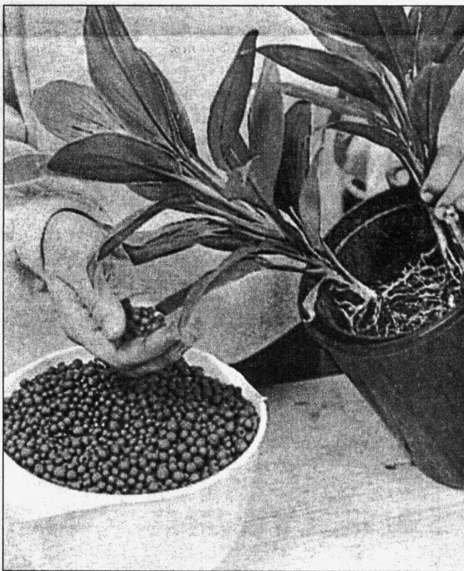
Весна — пора менять дренаж и землю

На улице значительно потеплело, и все ближе тот роковой день, когда в наших квартирах отключат центральное отопление. Растения, привыкшие за зиму к достаточно жаркому климату, могут на это болезненно отреагировать. Поэтому пора приучить их к новому температурному режиму. В теплые, солнечные дни открывайте форточки и проветривайте квартиру, не забывая о том, что чрезмерная прохлада может повредить вашим зеленым питомцам. При проветривании нужно убирать растения подальше от сквозняков. А когда сойдет снег и