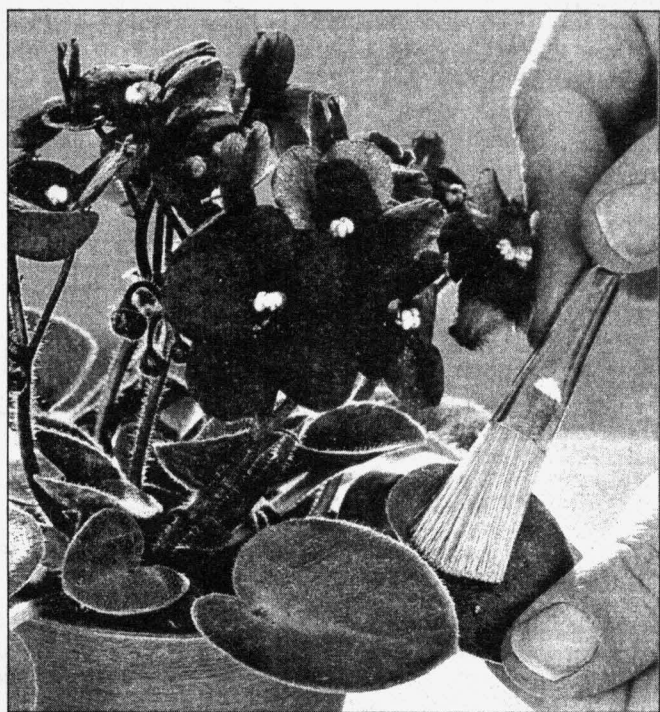
Фиалки не любят водные процедуры, они предпочитают сухую чистку

Это только кажется, что до настоящей некалендарной весны еще далеко. На самом деле она уже пришла, и первыми это почувствовали комнатные растения. Уже в конце февраля они стали пробуждаться ото сна: давать новые побеги и почки, набирать цвет, в общем, всячески демонстрировать свою готовность цвести и пахнуть. Но некоторые цветоводы не замечают этих тонких намеков. Им надо говорить прямо в лоб, мол, весна пришла, поухаживайте за нами! К сожалению, растения не умеют говорить, но если представить, что они вдруг обрели дар речи, что бы они нам сказали?