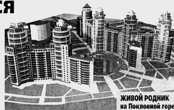
ЖИВОЙ РОДНИК на Поклонной горе

Лицензия серия ЛП СПб №78-017134 рег.номер 12430/2000 от 28.11.2000