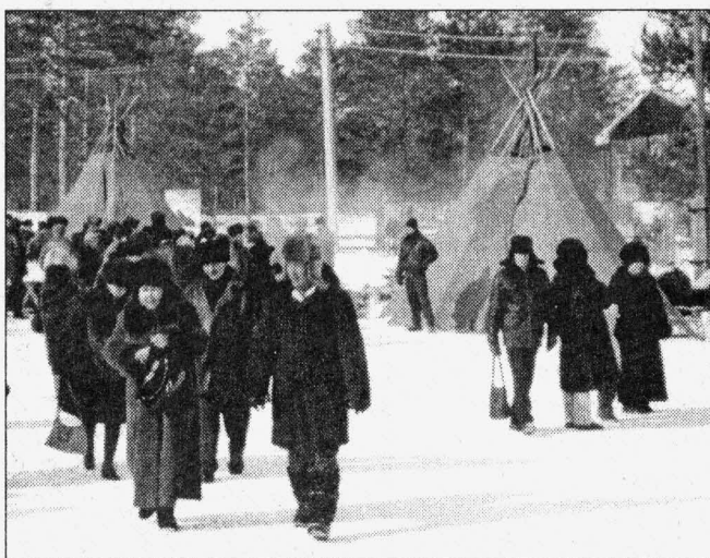
Народу было много