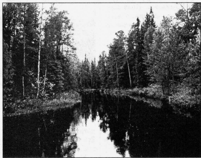
Здесь ловится почти все!

ловку, а на блесны и воблеры (плавающие) — щука. Будьте осторожны: запросто может схватить крупняк! Чтобы обследовать это место, у вас уйдет не одна поездка! До верховья речки около 12-14 км по воде. Особенно там будет интересно с середины июля, когда вода начнет падать, но и сейчас там отличная рыбалка (и места краси-