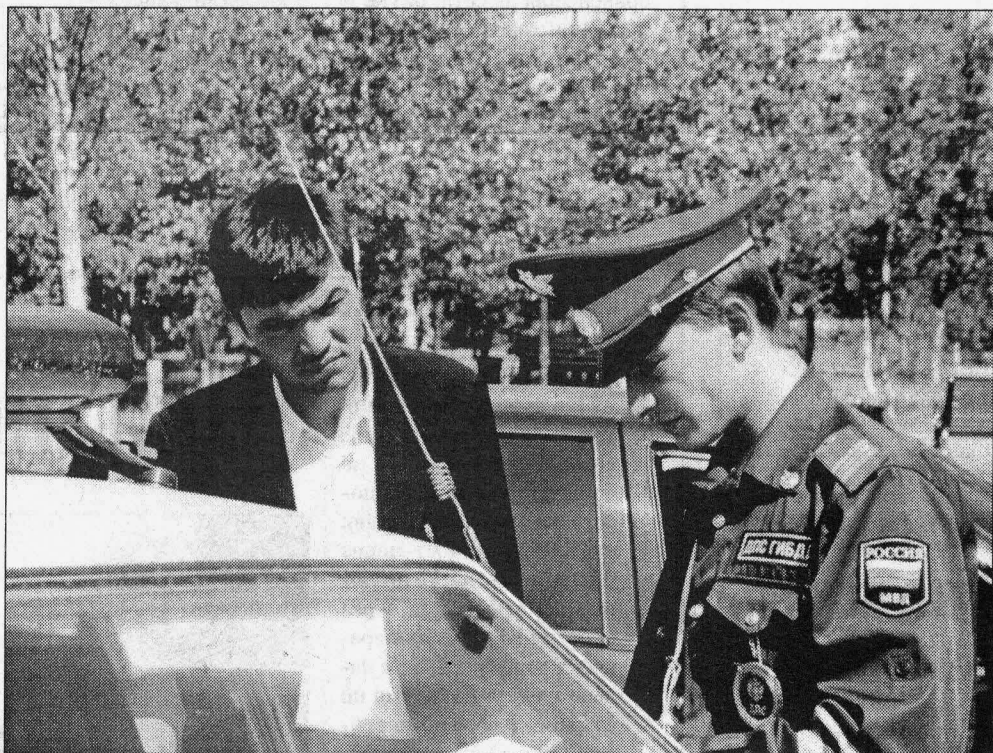
Разговоры и заполнение бумаг отнимают большую часть времени