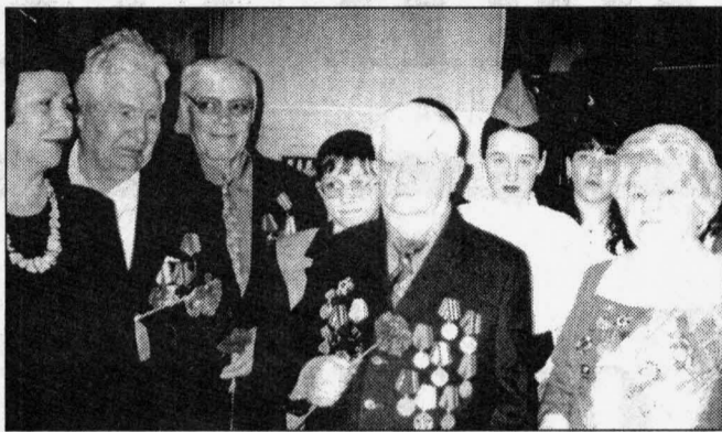
Ветераны помнят о войне и без праздников

В составе делегации ХМАО, приглашенной в Москву и Волгоград на празднование шестидесятилетия победы в Сталинградской битве, не будет ни одного представителя Сургута. И не потому, что у нас нет фронтовиков-сталинградцев. У всех сургутских ветеранов Сталинграда подкачало здоровье, ведь это люди очень преклонного возраста.