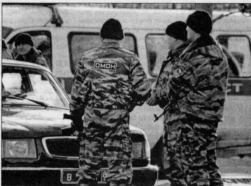
Лица они предпочитают не «светить»

Окончание. Начало на стр. 1. В тесноте да не в обиде под бластные песенки ребята ехали на свой скромный ежедневный подвиг.