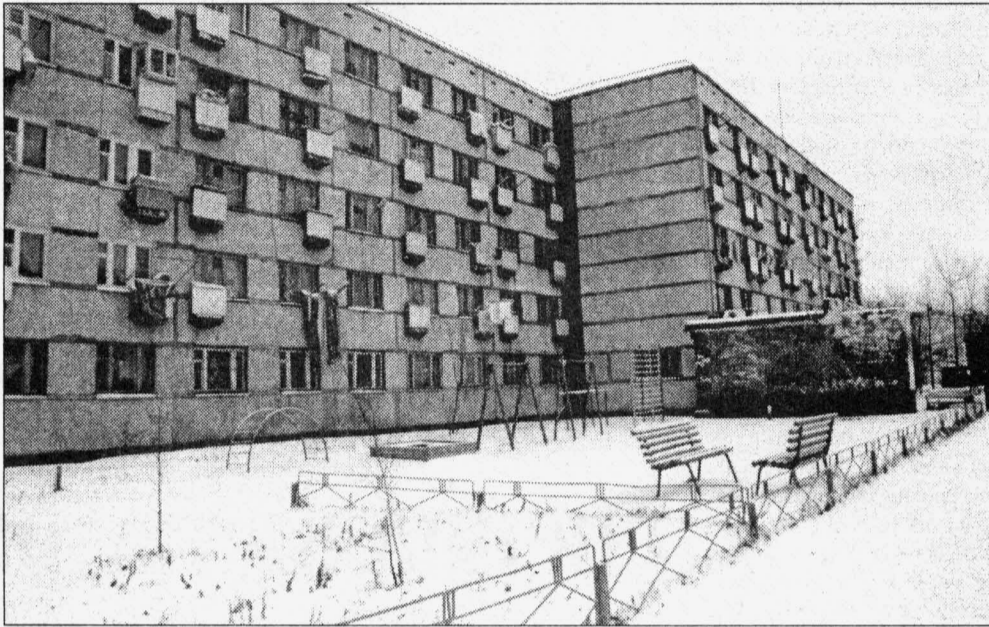
В этом общежитии началась история с 317-й комнатой, здесь же она и закончилась

Окончание. Начало на стр. 1. Ей говорили: «Вас долго не было, а оставлять пустующую комнату жалко». Все вещи из комнаты были вывезены, и так как ценности для мастеров ЖЭУ они не представляли, выброшены. По этому факту даже спешно составили справку: «Акт о вскрытии входной двери комнаты для проведения ремонтных работ».