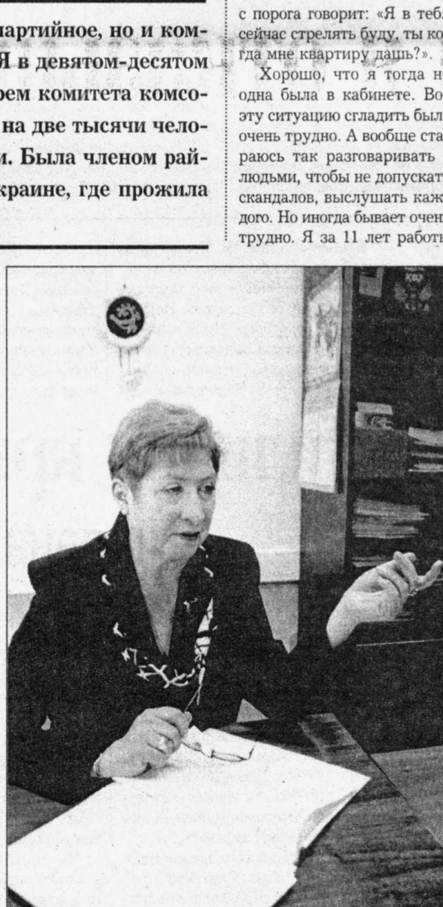
От глаза и плохого слова нужен оберег

на глазах. Но бывают и скандалы, грубияны. Я помню случай, когда только первый год работала. Зашел азербайджанец, он служил ранее в Афганистане. И, первый раз увидев меня, сразу