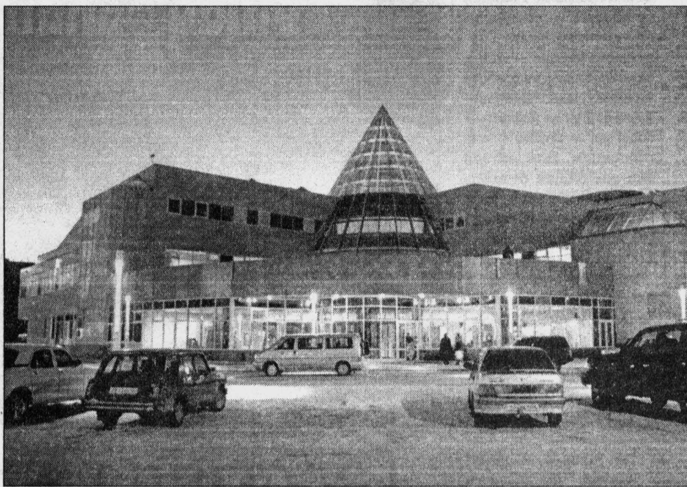
Аэропорт Ханты-Мансийска: увеличится ли количество рейсов в Тюмень?

Реформа местного самоуправления помимо финансовых издержек приведет к неоправданному росту чиновничьего аппарата в регионах, полагает заместитель руководителя фракции.