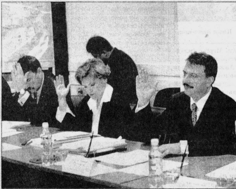
Утвердили оклад мэра

титься к вышестоящему руководству филиалов и наладить контроль над качеством и своевременным оказанием услуг. Если сейчас это не будет сделано, то к лету ситуация обострится кратно.