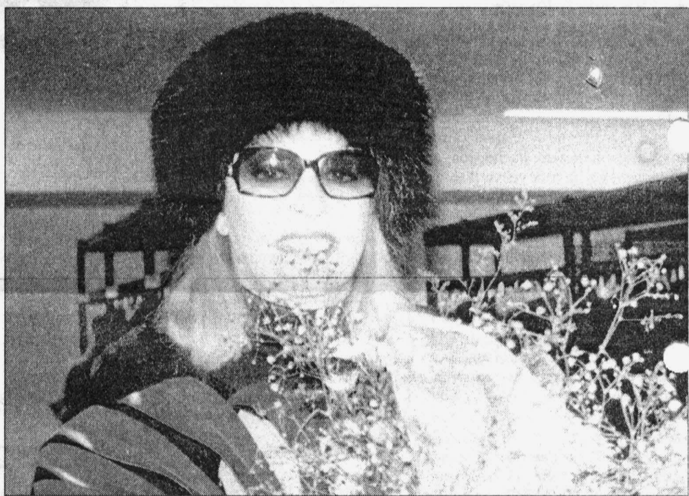
Анжелика изменилась, но ее глаза по-прежнему остались полными света и жизни

муж всегда искал в ней, — символом красоты и дразнящей чувственности, объектом вожделения всех без исключения мужчин.