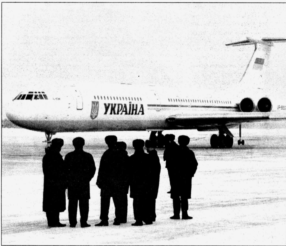
«Кого только не встретишь!». Вот недавно президент Украины Леонид Кучма прилетал...

Долго предназначение сургутского аэропорта было направлено на «производственные нужды». Когда геологи нашли нефть, нескончаемым потоком потянулись сюда вахтовики. Аэропорт в шестидесятых годах базировался на Черном Мысу. Здание небольшое, комнаты маленькие. Таким запомнился первый аэропорт начальнику службы