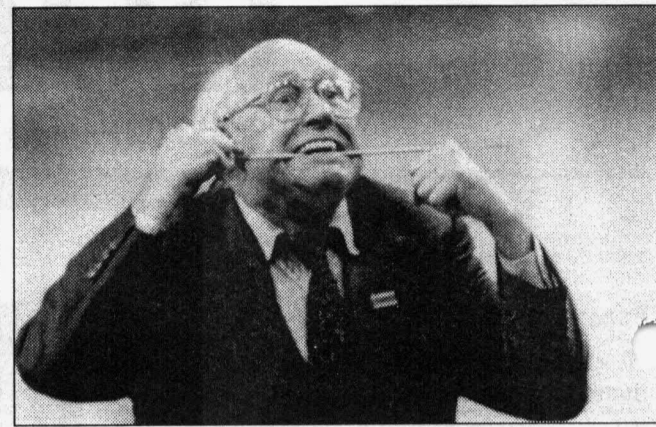
Человек мира Ростропович говорит на разных языках

Государственная Дума в третьем чтении приняла законопроект «О государственном языке». Он содержит запрет на бранные и просторечные слова и вводит ограничения на иноязычные слова при использовании русского языка в качестве государственного.