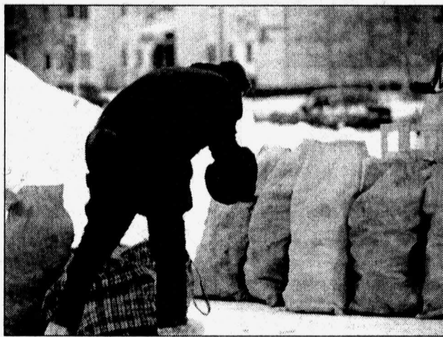
Для тех, кто вылетел с работы «по статье», пособие станет еще меньше

Новая редакция закона принесет не самые радостные известия для определенной категории граждан. Для людей, уволившихся с работы по собственному желанию без уважительной причины, пособие по безработице сократится не только в размере, но и по времени выплаты. Если раньше пособие для данной категории граждан начислялось в процентном отношении к среднему заработку и выплачивалось в течение года, то теперь размер пособия будет составлять 40 процентов от величины прожиточного минимума, исчисленного в субъекте федерации. Первоначальный период такой выплаты будет составлять лишь полгода.