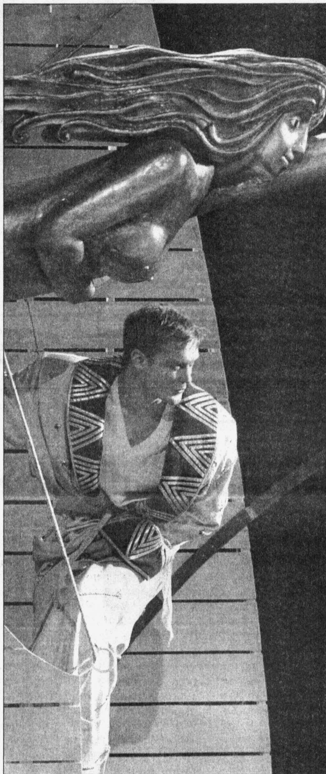
Сцена из спектакля «Золотая цепь»

Куда «посыпались» актеры? Если это интересно читателю, то в каждом