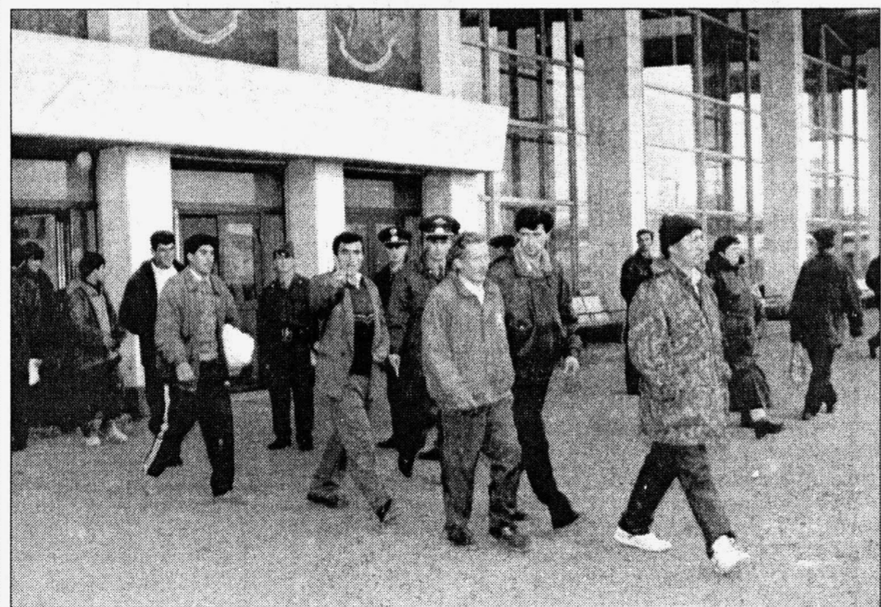
О депортациях пока придется забыть

Так что, если вы видите, что на каком-то сургутском предприятии работают таджики, можете быть уверены — это нелегалы. При желании сообщите об этом в соответствующие органы. На руководителя-нарушителя со-