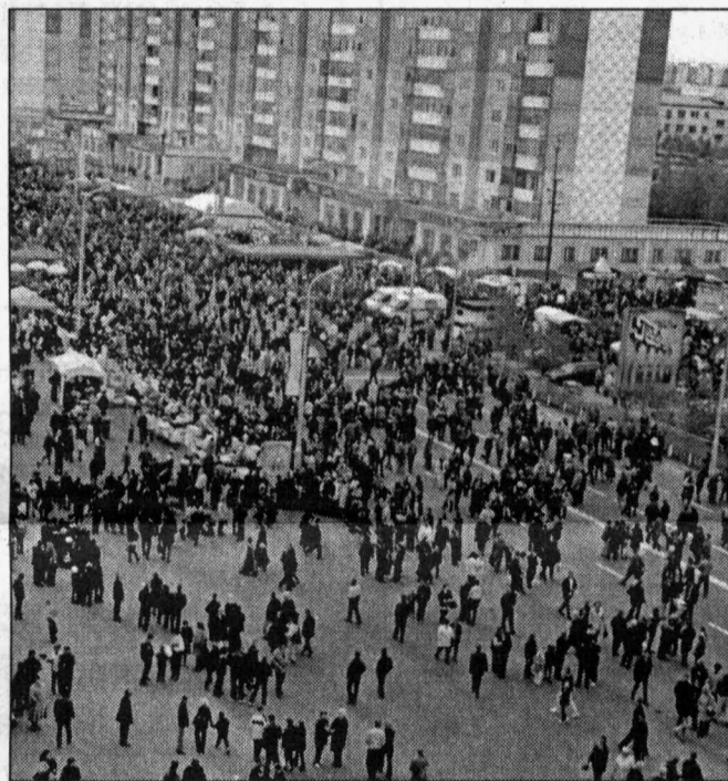
И всех их перисчитать...