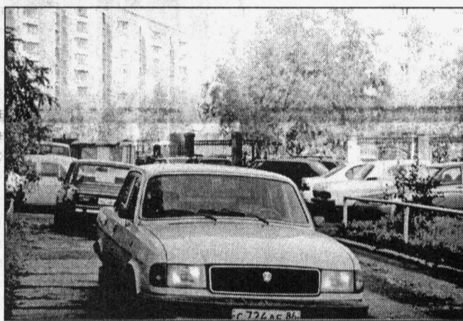
Один из типичных сургутских дворишков...