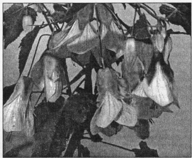
Абутилон всегда держит хвост пистолетом

которое украсит любой угол в доме или офисе.