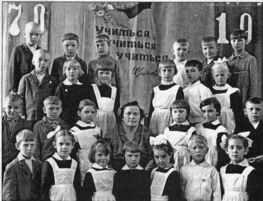
Узнаете своих родных или знакомых?

В городском обществе старожилов около семи тысяч человек, добрая половина из них училась за сургутскими партами. Школа помнит их и по праву гордится своими воспитанниками.