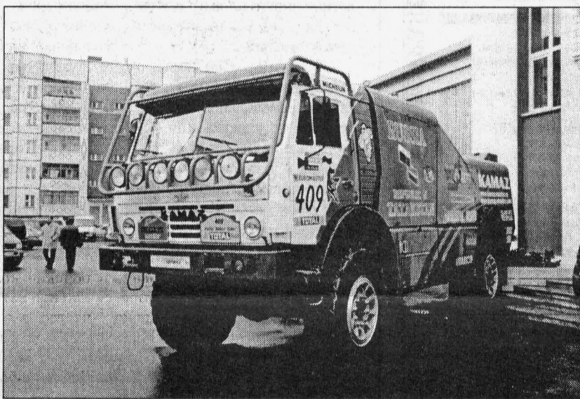
КамАЗ представил гоночный грузовик

Генеральный директор «Сургутнефтегаза» Владимир Богданов публично выразил свое мнение по приватизации нефтеперерабатывающих заводов в Белоруссии и на Украине. И там, и там «Сургутнефтегаз» хочет участвовать в покупке акций хоть одного НПЗ. Но переговоры как коту под хвост: белорусский президент Лукашенко не хочет договариваться, продавая российский нефтяникам контрольный пакет акций. Можно пойти к президенту Украины Кучме, но тому не до приватизации. «Видите, что там делается», — объясняет Богданов, имея в виду затеянный оппозицией импичмент.