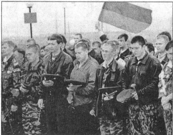
Минута молчания в память о павших...

Для справки: общая протяженность российских границ составляет 60932 километра. Тюменская область граничит только с одним государством — Казахстаном. Общая протяженность этой границы — 186 километров. На всей ее протяженности действуют четыре пограничные заставы.