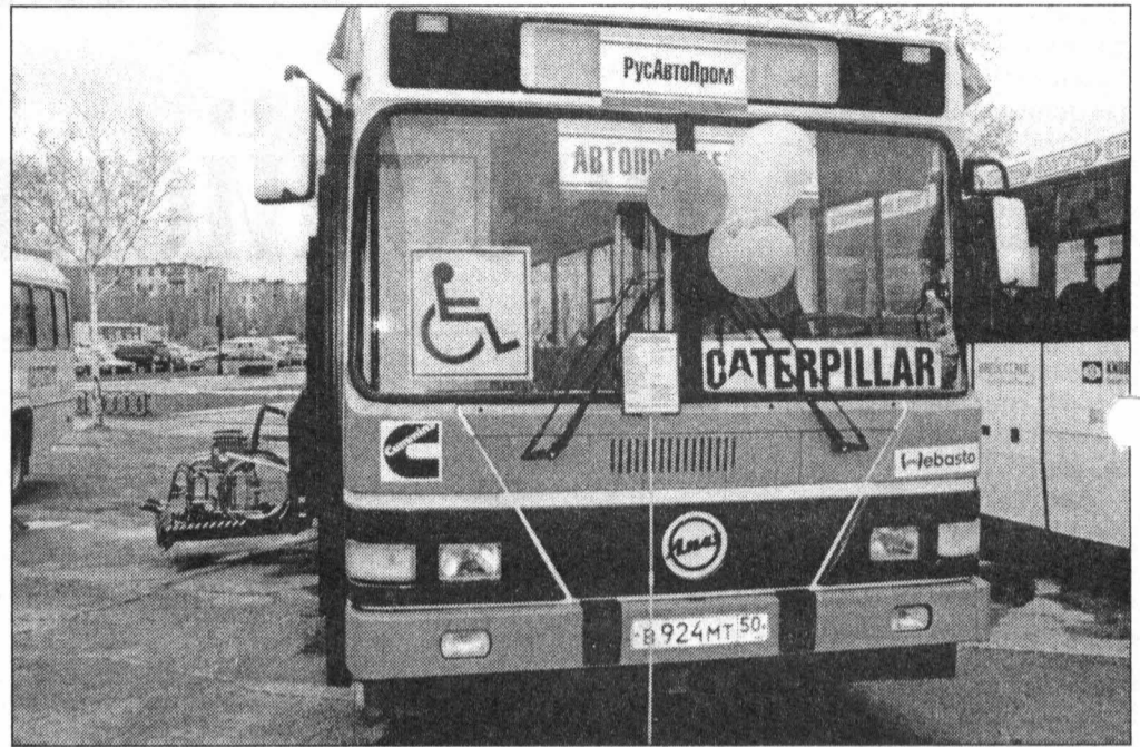
Автобус-то наш, а надписи — иностранные

кина: «Насосы отправлены на Урал, высылаем сто штук бигуди», наши заводы давно перестали. И, если раньше отношения с клиентами лучше характеризовались словом «волокиста», теперь производители поняли, что рискуют потерять потребителя, если не начнут с ним работать вплот-