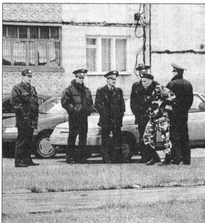
Пограничники охраняют границы, милиция охраняет пограничников