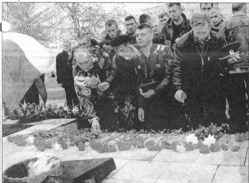
Вечная память героям