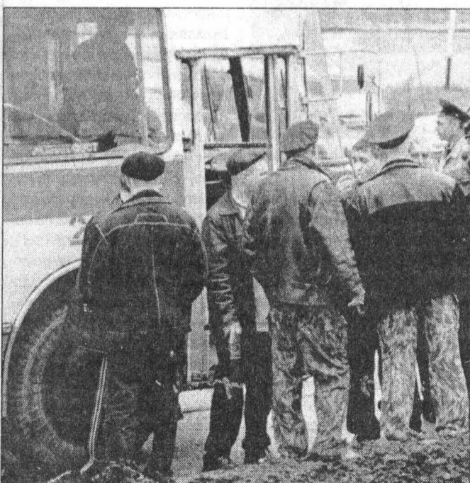
Официальная часть закончилась. Впереди веселье