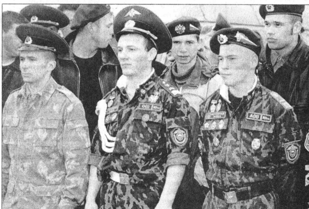
Вот они — герои дня