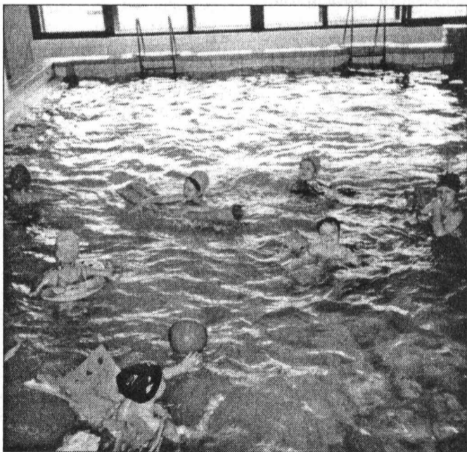
Это тоже «танцующие рыбки», но пока они только учатся плавать...

плавания «Дельфин», заняли первое место в групповых упражнениях. Вне зачета выступала созданная в январе 2002 года группа