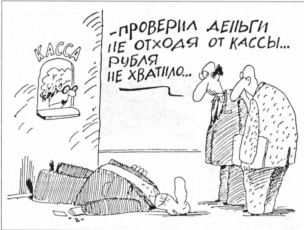
Рис. М. Давыдов

пять процентов. Неприятный отчет о ходе выполнения бюджета-2002 с пометкой «неудовлетворительно» подписан председателем правительства и направлен в качестве информации на июньское заседание Думы ХМАО. Не выполнены плановые назначения. Доходы округа исполнены на 86,6 процента по отношению к квартальному плану и составляют 16,7 процента от годовых. Структура доходов снова изменилась, причина — нововведения в федеральном законодательстве. Сейчас основные поступления обеспечивает налог на добычу полезных ископаемых, его доля в окружном бюджете равна 44,7