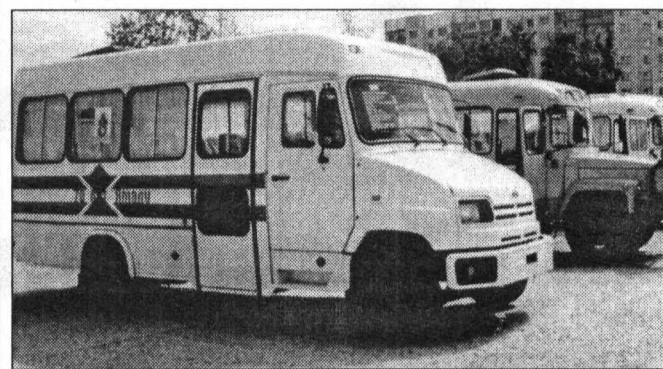
Эти автобусы ездят по Уралу и Сибири, чтобы привлечь к себе и всему российскому автопрому внимание

27 мая в Сургуте прибывает колонна автопробега, организованного компанией «РусАвтоПром», единственным официальным российским дистрибьютором по продаже автобусной техники. Автопробег с 15 мая движется по городам Сибири и Урала.