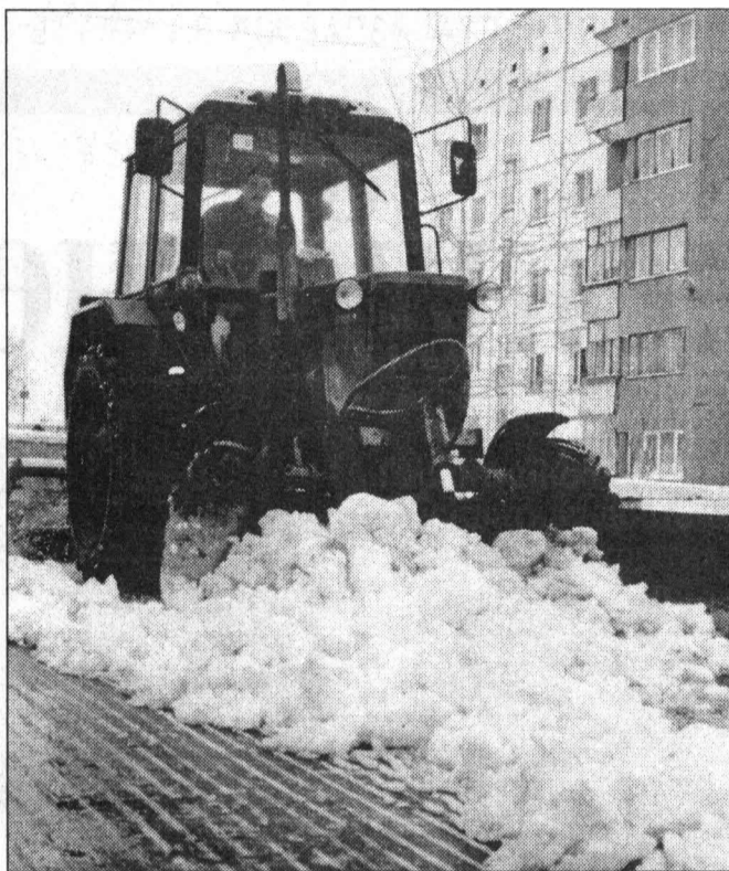
Дан приказ: чистить город от снега!