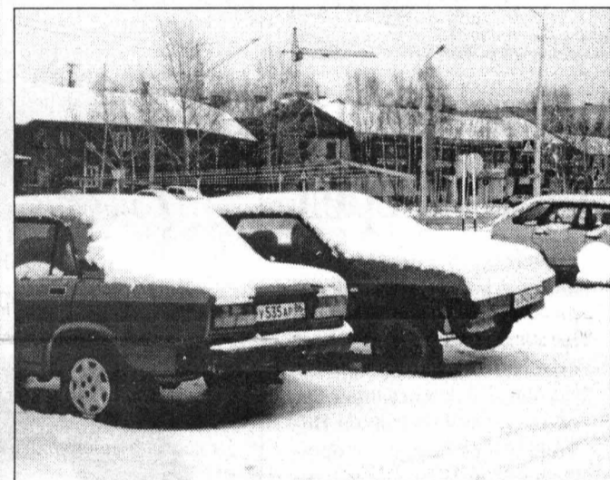
Майский снег укрыл автомобили...