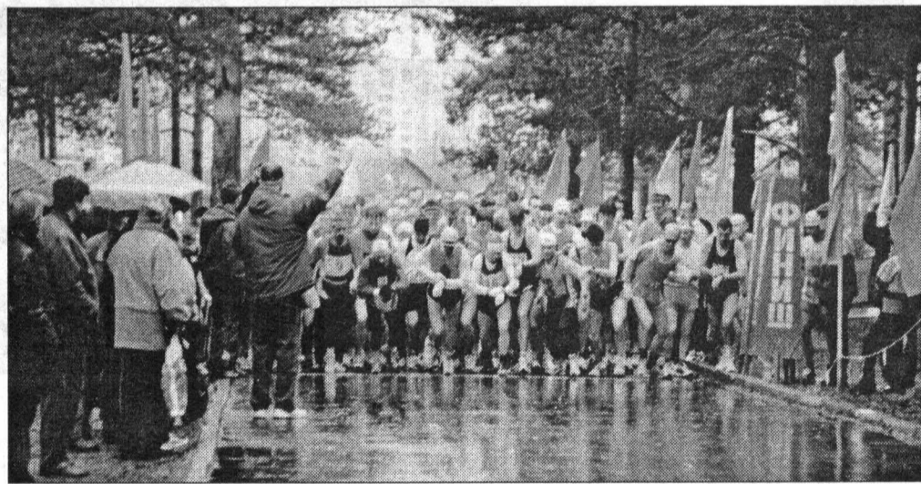
До старта — одна секунда!

Окончание. Начало на стр. 1. Напомним, что мировой рекорд в марафонском беге принадлежит марокканцу Халид Ханноу, — 2 часа 5 минут 42 секунды. Рекорд России — 2 часа 9 минут 16 секунд, установил его в сентябре 1999 года Леонид Швецов.