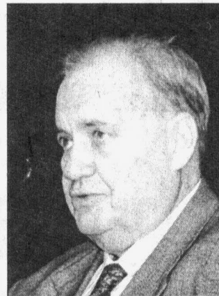
Эльдар Рязанов в Сургуте дарил свои книги

Окончание. Начало на стр. 1. Фонду Эльдара Рязанова, который создан для поддержки музыкального