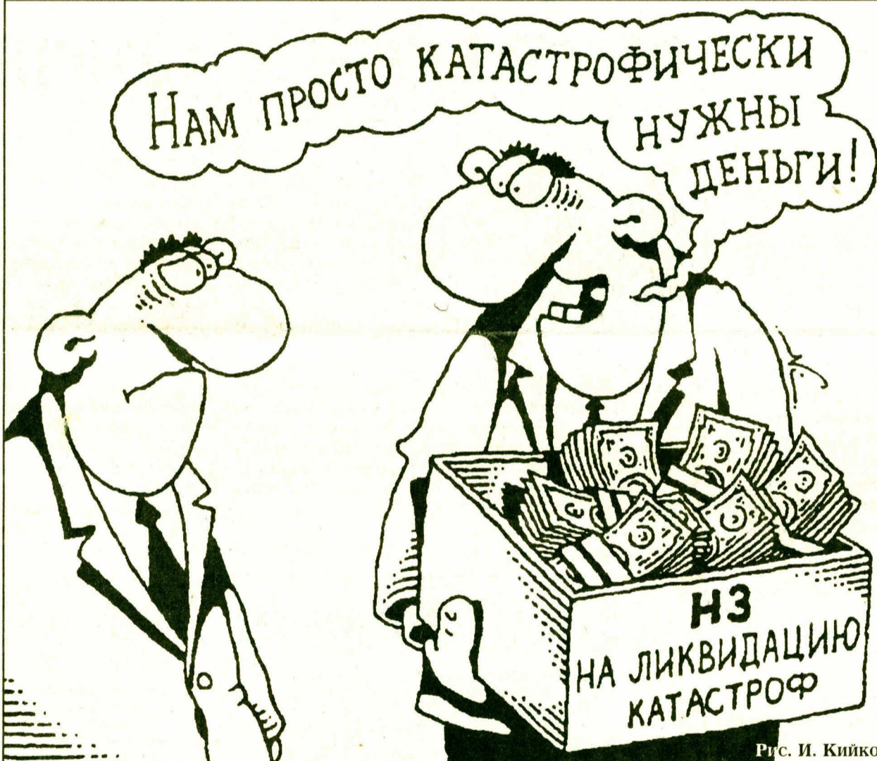
Рис. И. Кийко

В сфере государственного экономического подхода к использованию месторождений нефти и газа назрели коренные изменения. Необходимость пересмотра существующей схемы получения и распределения доходов от добычи нефти и газа понимается и федеральной, и региональной властью, и руководством нефтяных компаний. Государство недовольно тем, что получает слишком малые налоги, о чем весьма недвусмысленно заявил Владимир Путин на недавнем совещании в Уренгое.