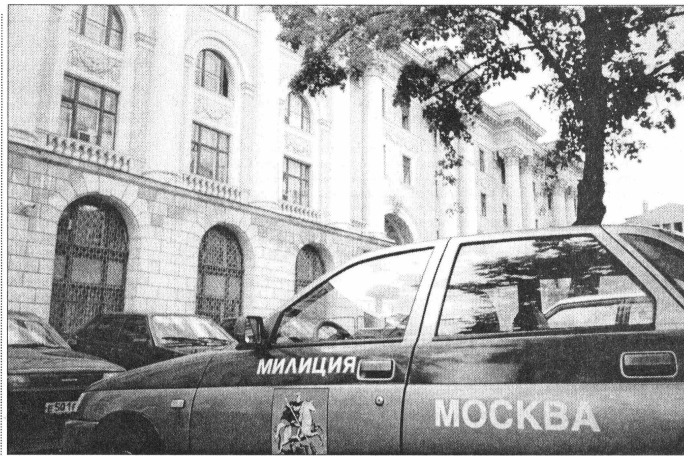
Дело Иванова перешло под контроль МВД России

Одним из первых, приехавших на место преступления, был первый зам. начальника УВД Юго-Восточного округа Москвы Анато-