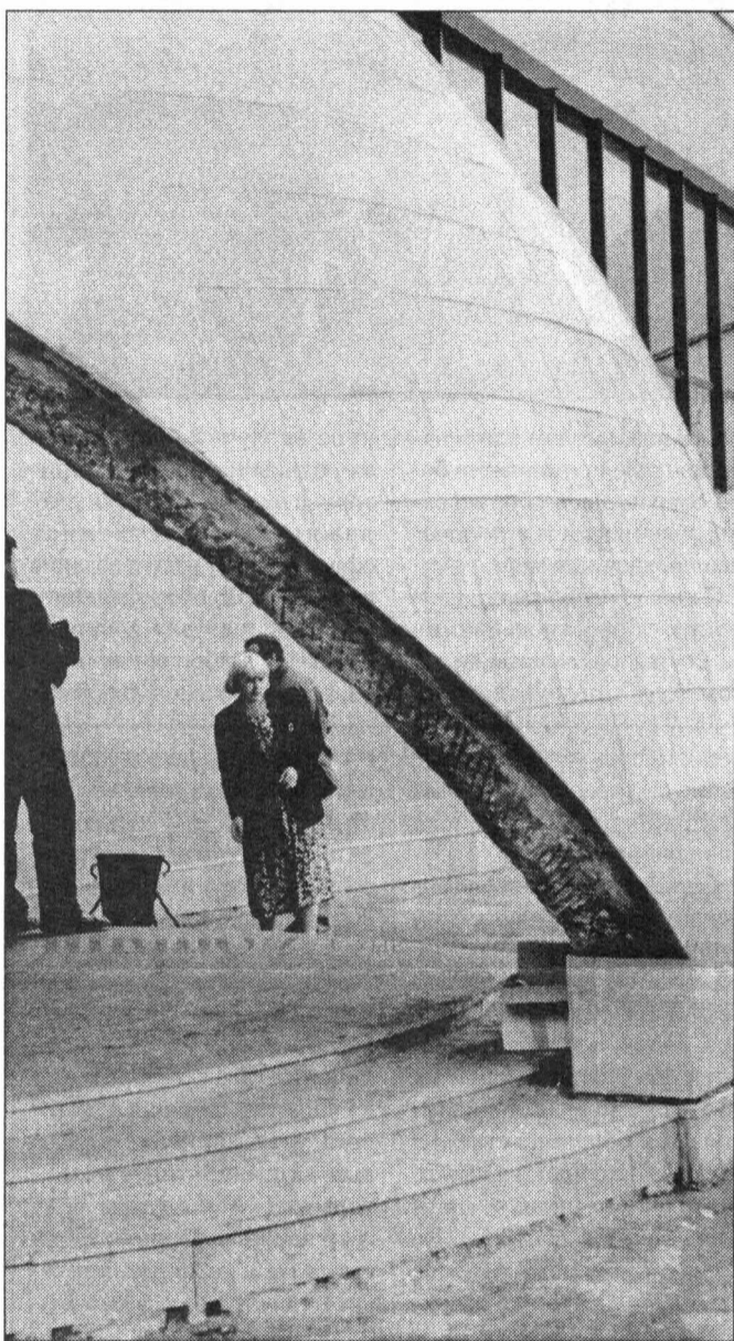
С плиткой «не угадали»...

Окончание. Начало на стр. 1. Большой зал ожидания встречающих, два транспортера, по которому в зал будет поступать багаж. Кроме того, там будут располагаться производственные структуры аэропорта. На втором этаже мы планируем сделать большой бизнес-зал. Нынешним бизнес-залом пользуются те, кто купил билеты в салон бизнес-класса. А все потому, что помещение слишком мало, чтобы обслуживать всех желающих. После пуска нового сектора услугами бизнес-зала смогут пользоваться все пассажиры, за деньги, конечно.