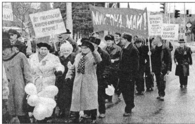
Но не всех этот рост устраивает...

Относительно высокий уровень материальной обеспеченности населения сложился в Сургуте, Ханты-Мансийске, Нижневар-