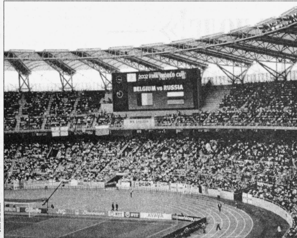
Этот матч мы запомним надолго...