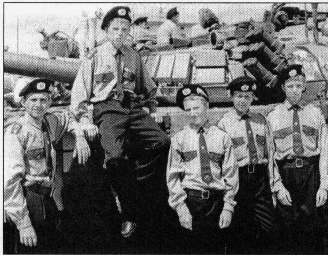
Ребята из группы «Витязь». Эту технику они восстановили сами

Подписан договор о сотрудничестве между Центральным музеем авиации России и Сургутской городской станцией юных техников. В соответствии с ним объединение стендового моделизма СЮТ будет восстанавливать музейный фонд — самолеты и вертолеты. На базу музея в поселок Монино Московской области первая экспедиция отправится летом 2003 года. С начала нового учебного года на СЮТ начнется подготовка юных авиатехников.