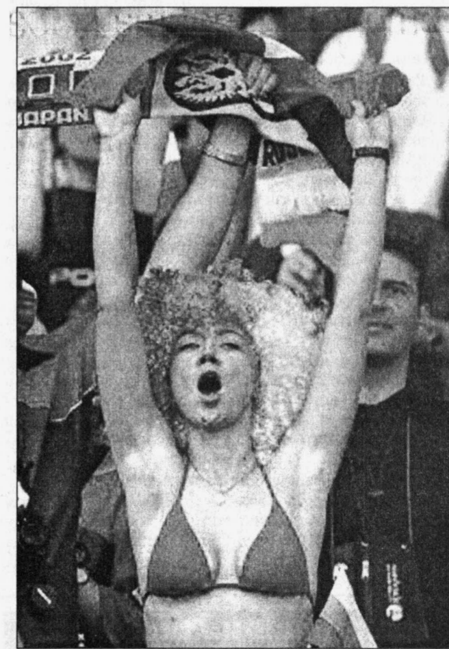
Наши проиграли, потому что отвлекались от игры

стрих. Во время голевых моментов болельщики вскакивают, машут руками, свистят. Полицейские все время контролировали нас, подходы к нам, усаживали на места, в то время как японским болельщикам кричать, вскакивать с мест разрешали. Тем не менее я болел за Россию так отчаянно, что охрип. После проигрыша за нашу