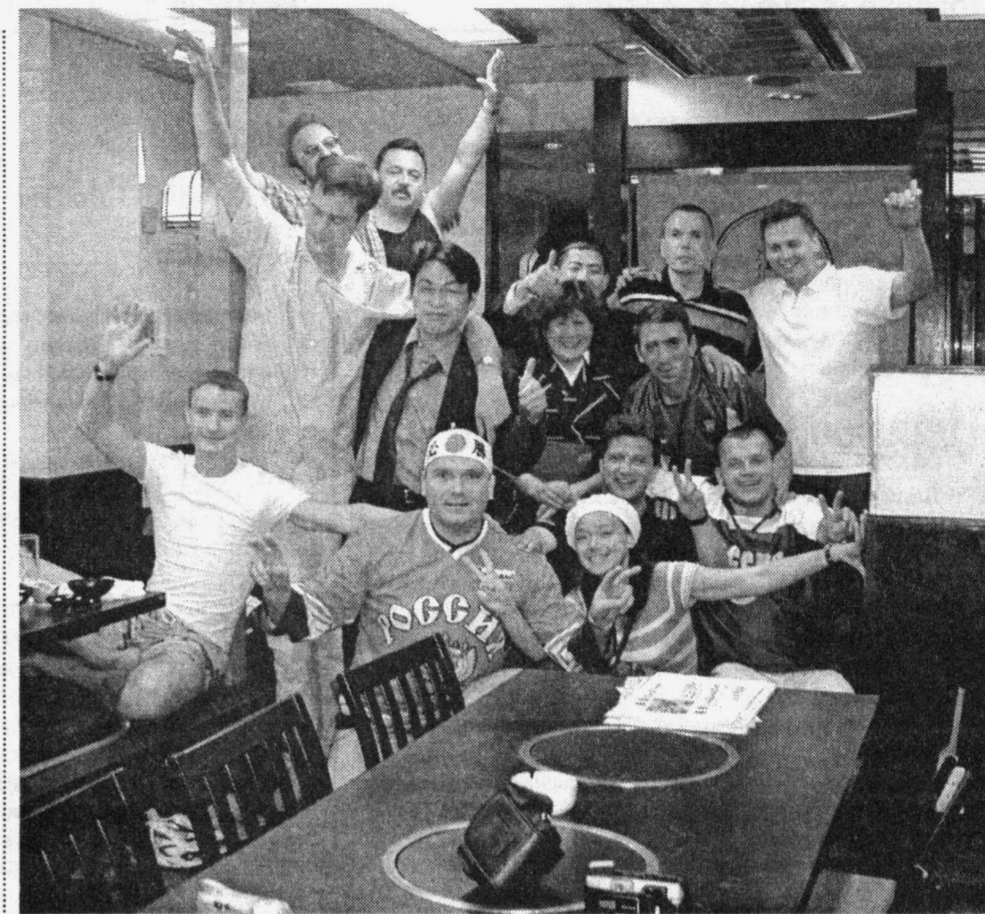
Так отмечали победу над Тунисом

А. Токарев: Ну а центральный матч с японцами, билеты на который продавались по 2,5 тысячи долларов, подтвердил опасения. Сложилось впечатление, что японцы боялись нашу команду, но смогли ее переиграть лишь потому, что верили в успех. Для нас игра получилась сложной в моральном отношении. Нашим болельщикам зачастую не давали нормально поддерживать команду. Такой