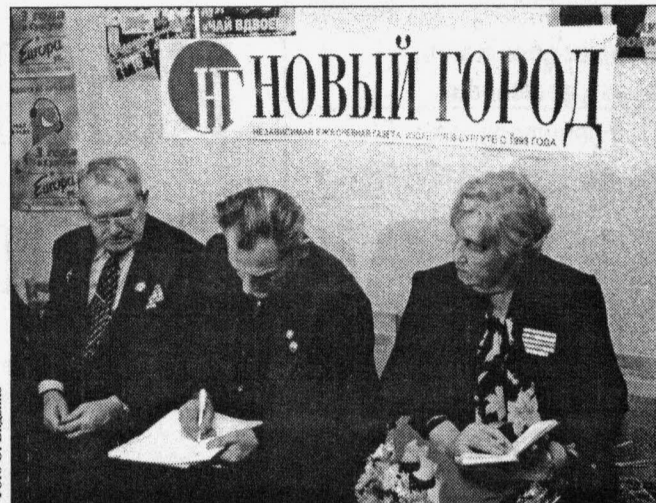
Наблюдатели подписывают протокол о результатах розыгрыша

Кстати, можно сказать, что на выигрыши Раисе Михайловне везет. Еще в со-