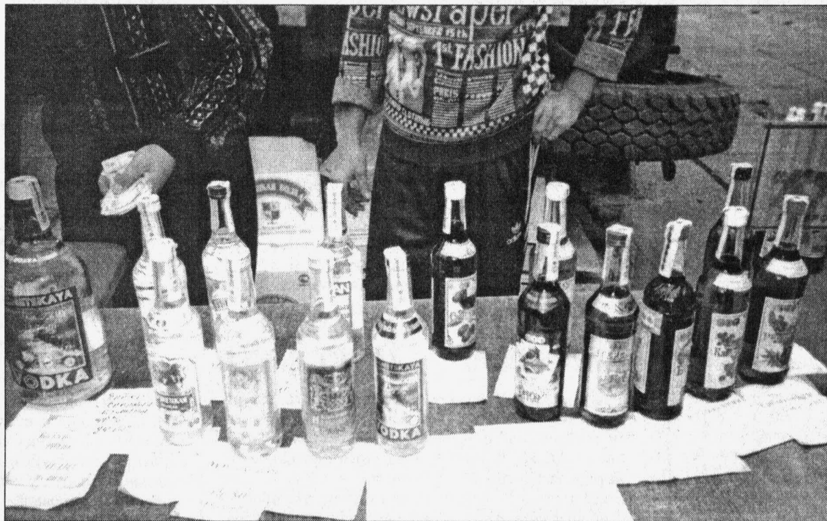
Дешевая водка — это хорошо или плохо?

Неизменной осталась цена на дизтопливо. А вот стоимость хлеба из муки 1 и 2 сорта, вареной колбасы, животного масла, отечественной водки и бензина А-92 немного снизилась, в пределах 0,2-1,2 процента. Заметнее всего подешевел бензин марки А-76, на три с половиной процента.