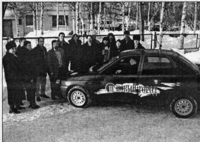
Фото на память с «новгородцами»