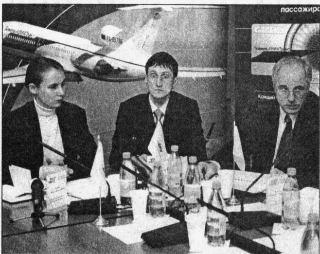
Во время презентации

Впрочем, обстоятельно расспросить ошарашенного водителя «КамАЗа» нам так и не удалось, две перевозбужденные пассажирки «шестерки» взахлеб кричали, что водитель лжет, и выдвигали свою версию происшедшего. Женщины с колоритной южной внешностью поперебой рассказывали сотрудникам ГИБДД и корреспондентам, что всей большой семьей едут из Тамбова в Нижневартовск. Ближе к вечеру они решили съехать с дороги и где-нибудь поехать. Кто-то из прохожих посоветовал