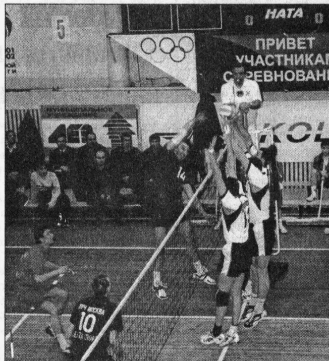
«Луч» — «ЗСК Газпром» — 0 : 0