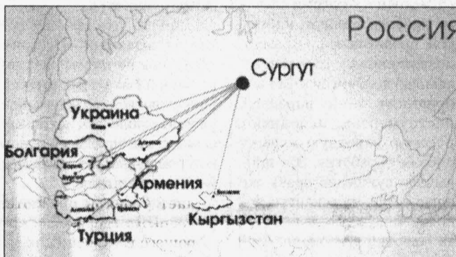
Карта международных рейсов

только «тушки»). В два раза увеличено количество рейсов в Самару. Теперь лайнеры «Тюменьавиатранса» будут летать в этот город шесть раз в неделю. В планах также от-