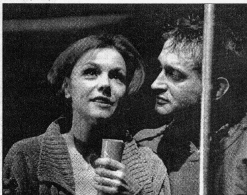
Сцена из спектакля «Утиная охота»

ляет ее муж, Олег Табаков. В детстве Зудина больше всего на свете хотела стать балериной. Но в хореографическое училище она пошла в десять лет, и хотя быстро набрала необходимую квалификацию, в балет ее все-таки не взяли. Но и в балете Зудину привлекали драматические партии, требующие таланта и умений не столько хореографических, сколько ак-