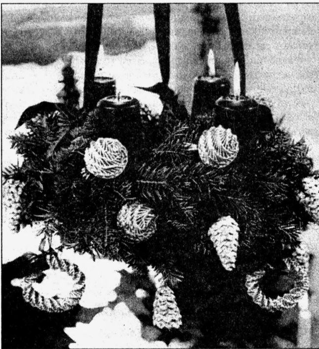
... а можно ограничиться живыми ветками

Напомним нашим читателям, что в лесничестве не одобряют срезку еловых веток. Особенно если с одного дерева срезается сразу несколько «лап». Это может его погубить. Охотников за ветками могут оштрафовать за нанесение вреда живой природе. Лучше покупать ветки на еловых базарах. Наверняка предприимчивые продавцы не упустят возможность сбыть «неликвидные» елки по частям.