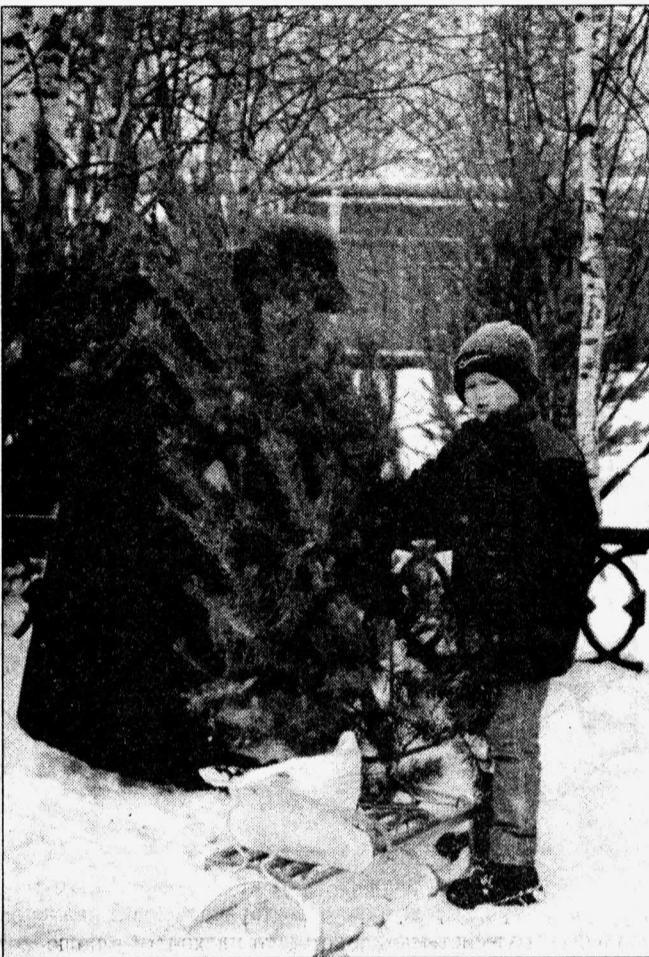
Можно купить целую елку...