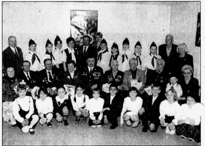
На встрече ветеранов с жуковским отрядом

Президиум городского совета ветеранов подвел итоги городского смотра-конкурса ветеранских организаций за 2002 год. Участвовали 32 организации, объединяющие шестнадцать тысяч человек. Особое внимание обращалось на работу по патриотическому воспитанию молодежи.