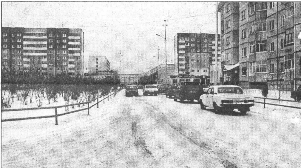
Количество дорожно-транспортных происшествий в Сургуте растет год от года.