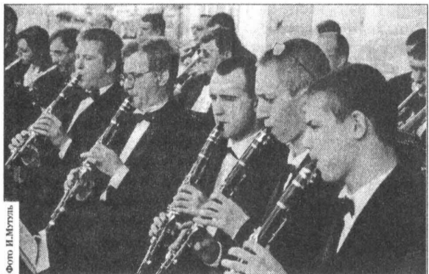
Группа кларнетистов на концерте.