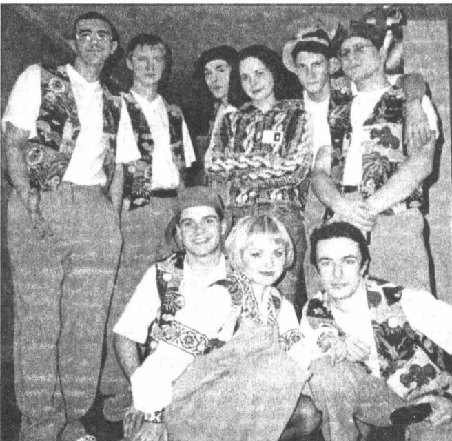
«Кин-дза-дза» в Новосибирске.

в один балл, то на «разминке» противников разделили уже четыре балла в пользу «Кин-