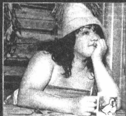
«НА ТЕБЯ УПОВАЮ» Героиня фильма бросила

своего новорожденного ребенка. Угрызения совести не дают ей покоя. После попытки самоубийства молодая женщина попадает в психиатрическую лечебницу. Затем приходит в церковь, работает там на поденных работах и по совету священника устраивается на работу в детский дом. Режиссер фильма Елена Цыплакова.