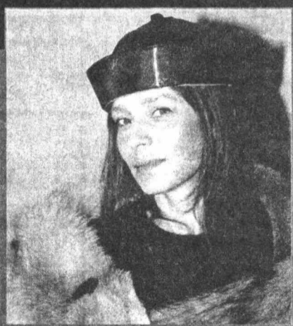
ленная больна раком... ОРТ, 13.15, понедельник.

Молодой человек поступает в театральный институт. Он талантлив, но шансов у него почти нет: он активно не нравится начальнице приемной комиссии. Что делать? Он решает соблазнить свою неприятельницу и неожиданно влюбляется в нее. Ему отвечают взаимностью, но вскоре выясняется, что его возлюб-