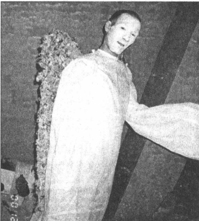
Арлекин этой ночи.

На втором этаже при обилии привлекательных парней в темных костюмах (охрана) внутри себя двигалась вечеринка. На небольшой сценке работали ди-джеи и ведущий, который ясно осознавал себя суперзвездой. Этот щуплый паренек с большим апломбом работал заводилой, массовиком-затейником местного разлива. Вместе с ним танцевали желающие из зала, по одному. Когда одна девушка валилась с ног, ей на смену шла другая.