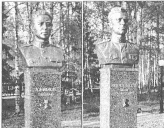
На главной аллее бронзовые бюсты Героев Советского Союза Тулебай Ажимова и Ивана Королькова.

В глубине парка памятник павшим воинам и огромные