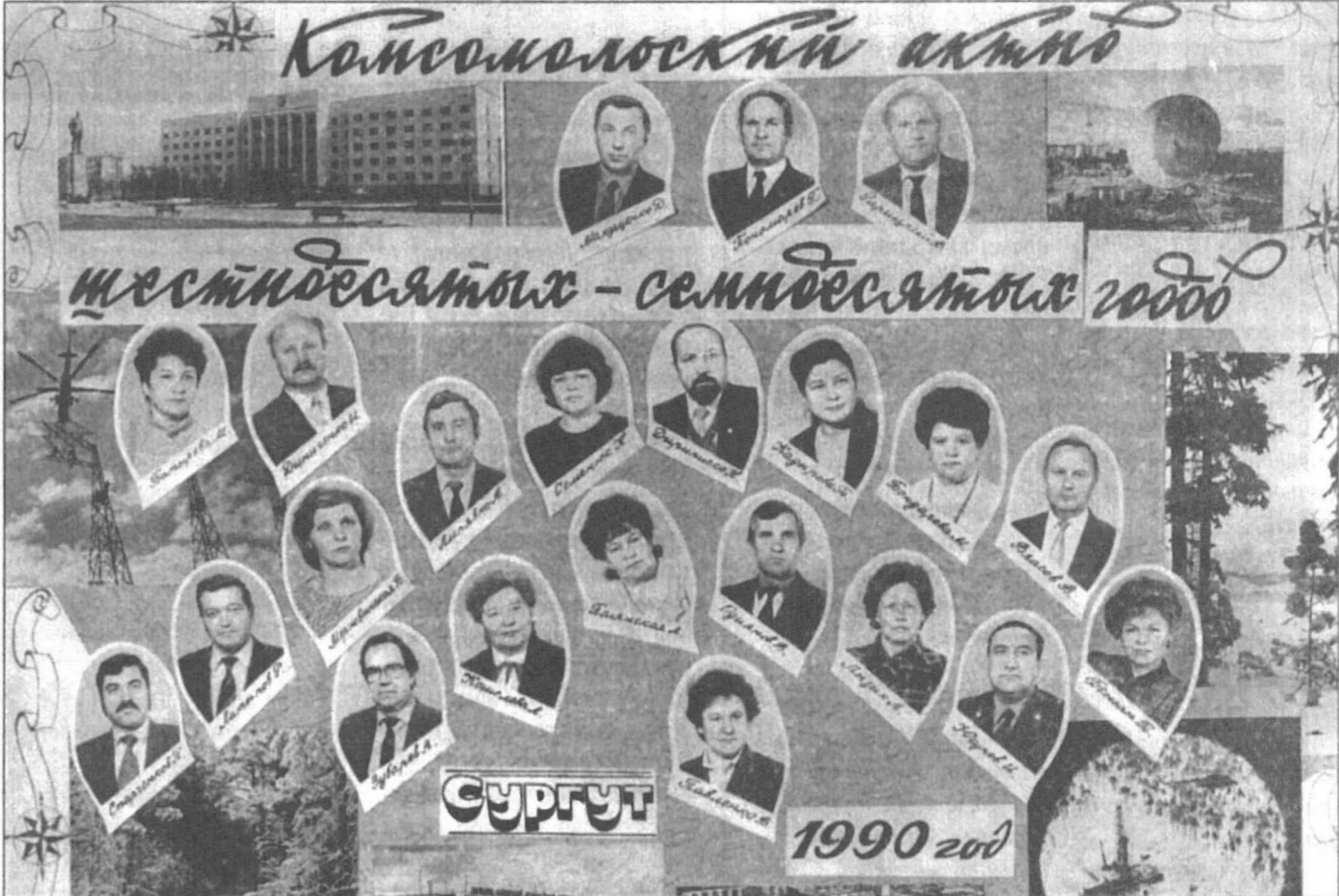
Ба, знакомые все лица.

были временами свадеб. Помещений для таких торжеств не было. Поэтому гу-