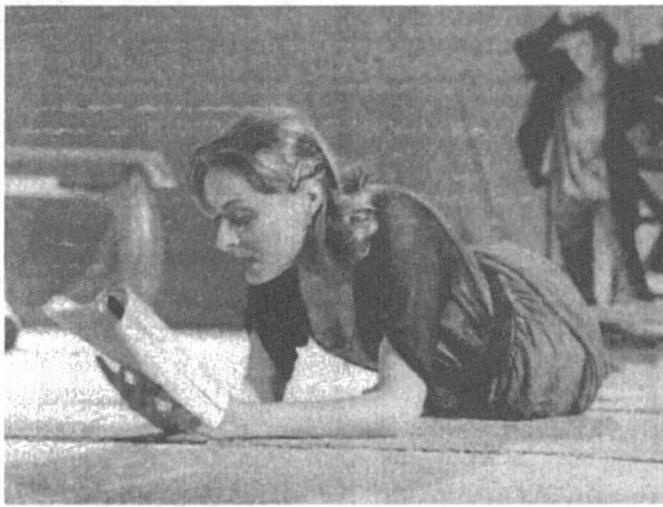
Сцена из спектакля «На дне» сургутского театра.

В этом году планируется ввести в строй четыре объекта, где разместятся учреждения культуры: здания музейного центра, художественно-промышленного колледжа, ДК «Магистраль» и центральной библиотеки.