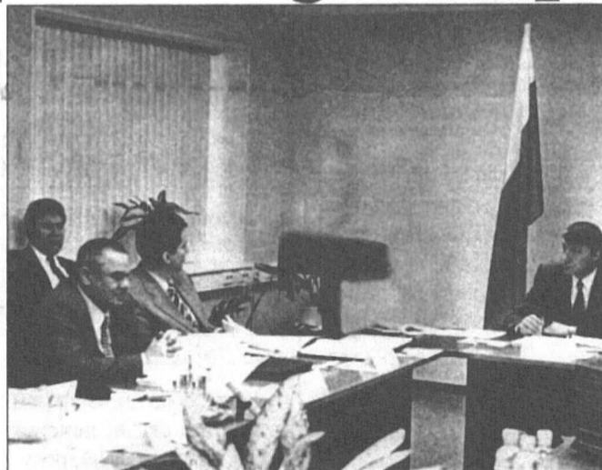
Вчера депутаты утвердили состав избиркома.