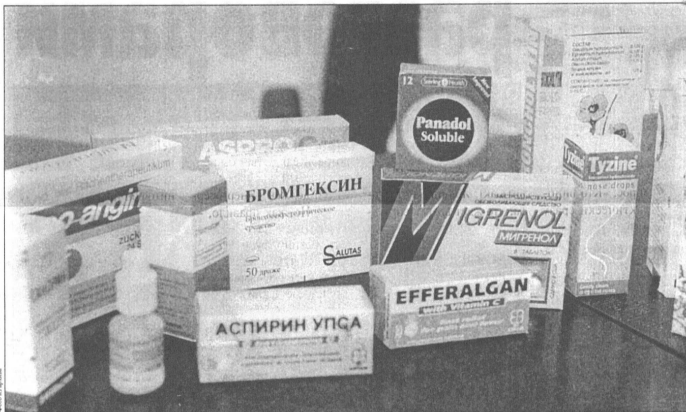
«Ходовые» лекарства можно найти в любой аптеке.

Постоянные клиенты «Сургутфармации» сетуют на растущие цены в государственных аптеках. Но упомянутое предприятие не увеличивает тарифы на изготовление лекарств по индивидуальным заказам, несмотря на то, что ежегодно повышается арендная плата, коммунальные услуги, оплата вневедомственной охраны.