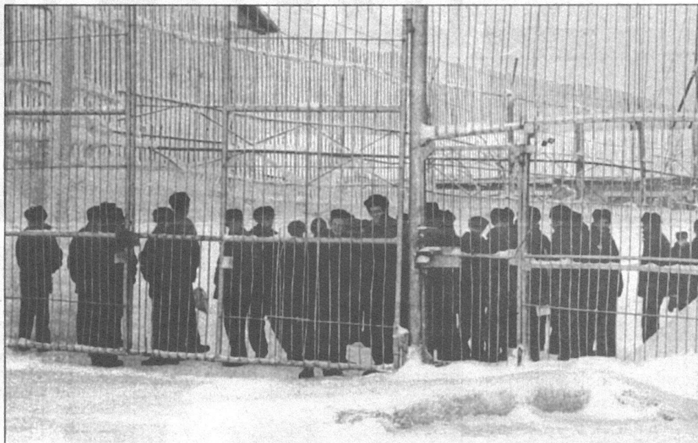
Даже в столовую в колонии ходят группой.