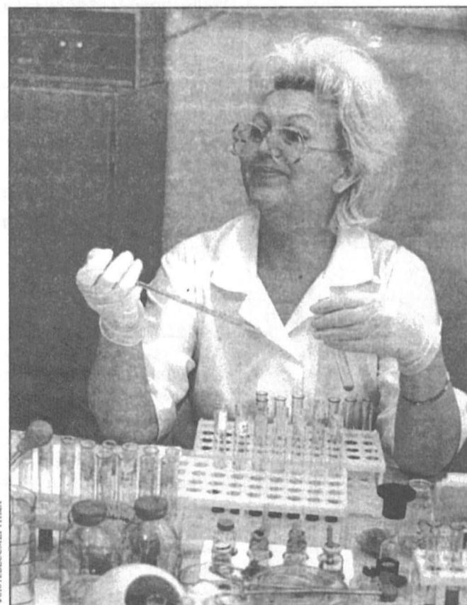
Внимательный лаборант не пропустит ни одного вируса.

городов и районов ХМАО. Как известно, основных путей передачи ВИЧ-инфекции два — половой и внутривенный, при пользовании зараженным шприцем. По Тюменской