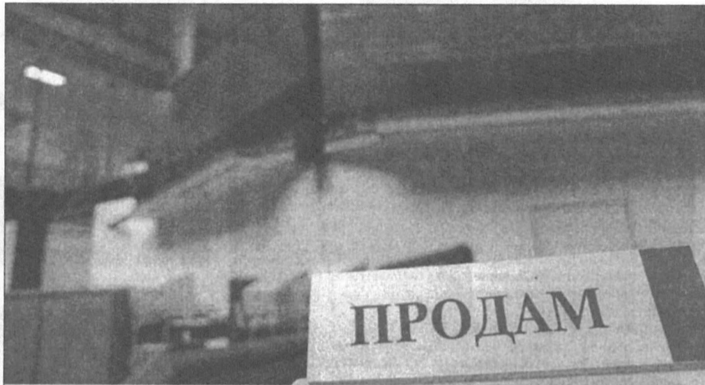
Еще недавно иностранные инвесторы жаловались: чтобы работать с российскими бумагами, нам нужны объемы. Предложить это им мог только ЛУКОЙЛ. Теперь и Сургутнефтегаз.

В кулуарах разговоры и мнения по поводу обмена разные. Присутствующие едины только в одном: выгодный коэф-