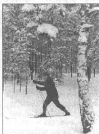
Прогулки на свежем воздухе — один из способов сбегать от «сидней».

В связи с прошедшей вакцинацией хочется отметить две страховые компании — «Сургутнефтегаз» и «Тюменьэнергогарант». Только эти страховые организации оплачивали вакци-