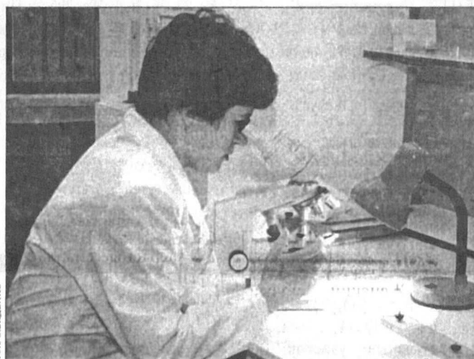
Момент исследования рыбы (жаль, что снимок под микроскопом сделать нельзя).

Стоит отметить, что обнаружить паразита в рыбе могут только специалисты. Мы лишь были сторонними наблюдателями в ходе лабораторного анализа, зато ни-