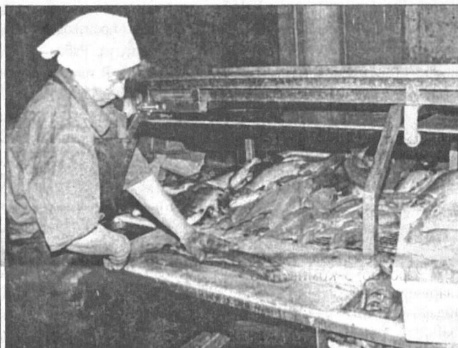
В рыбе Сургутского рыбокомбината описторхов нет.