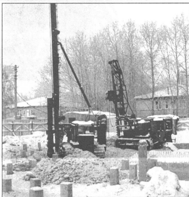
Вот оно близкое соседство новостройки с жильем.