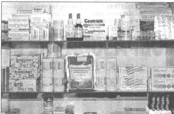
Витаминное богатство на аптечных полках Сургута.

Относительно российских препаратов собеседник отметил, что в них содержится мало витаминов, необходимых организму. Употребляя их, человек не восполняет нехватку других минеральных веществ и групп витаминов. Очень неодобрительно высказался Тесленко о продающихся сейчас в аптеках антистрессовых витаминных. Они не только не оказывают лечебного эффекта, но даже несут вред, поскольку имеют крайне высокую концентрацию отдельных видов витаминов (это, кстати, указано в таблицах на упаковке), частое применение их грозит здоровью. К примеру, один из антистрессовых препаратов содержит огромную дозу ас-