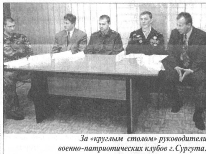
За «круглым столом» руководители военно-патриотических клубов г. Сургута.

Еще один совсем недавно созданный молодежный