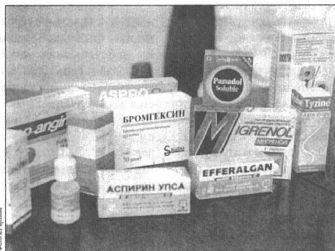
Это легальные лекарства.

много — это факт. Чем препарат известнее, тем больше риска, что он поддельный.