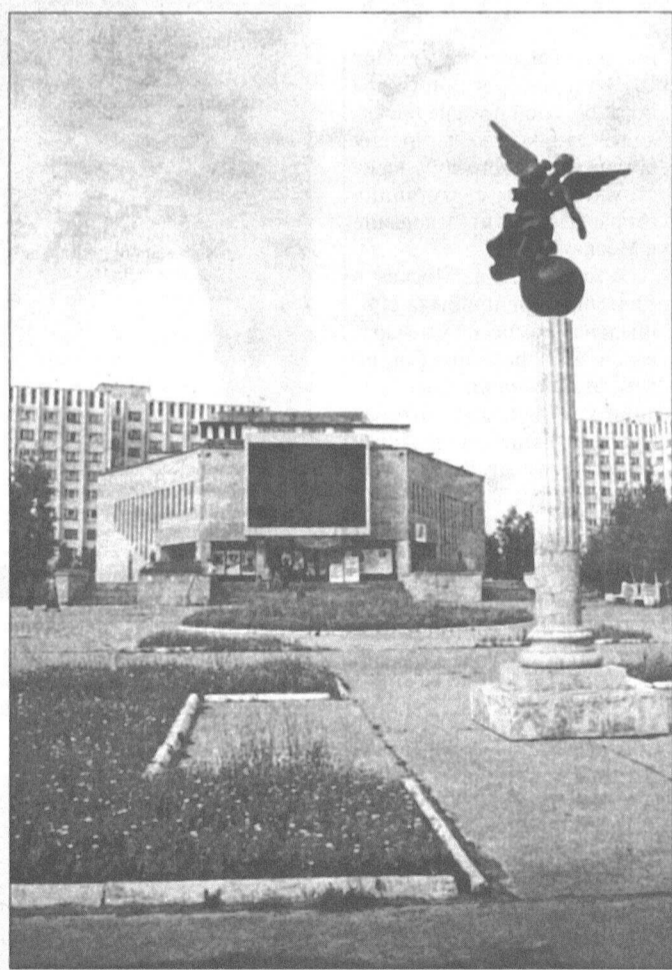
Здесь для сургутян «крутят» кино уже 15 лет.

российских кинотеатрах вот уже несколько лет висят амбарные замки, либо они переоборудованы в мебельные салоны. «Аврора» оказалась более стойкой. По статистике прошлого года она попала в десятку лучших кинотеатров России в городах с населением до 300 тысяч человек. Это радует.