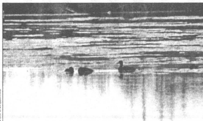
Вот они, потревоженные птицы.

нимаемся гидронамывом, чтобы создать прочное основание для подстанции. Это совершенно безвредно для животных, так как в процессе задействованы только песок и вода».