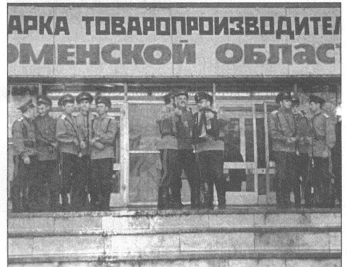
Хит ярмарки: «Распрягайте, хлопцы, коней».

ишимцев, у которых не было проблем ни с расселением в гостиницах, ни с размещением на площади, ни с доступом к представителям местной администрации. А участников к вечеру пытались найти многие. От представителей областного департамента по социально-экономическому развитию села до рядовых бизнесменов. И те, и другие хотели выйти с предложением