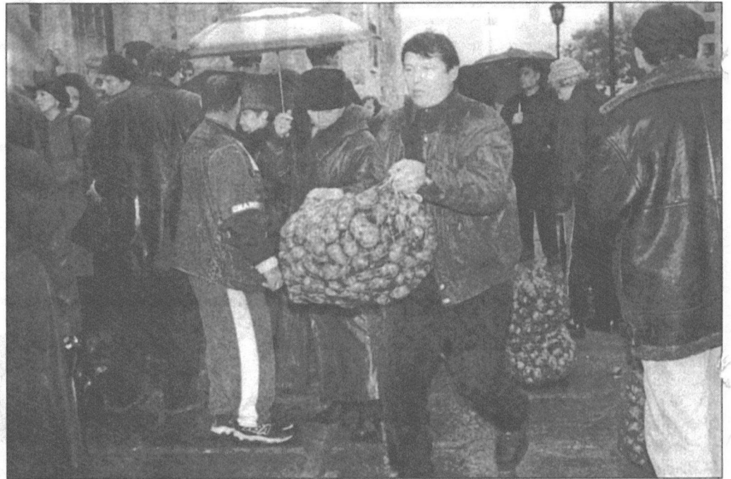
Картошку продавали по 3.50 за килограмм.

Остальные же, по большому счету, приехали торговать, помня о том, какой успех сопутствовал им на аналогичной ярмарке в Ханты-Мансийске. Там общий оборот составил более пяти миллионов. И здесь хотелось тоже поработать нормально, причем желания гостей соответствовали потребностям сургутян в качественных и дешевых продуктах. Но к вечеру многие стали говорить, что, несмотря на то, что их приглашал сам мэр, они почувствовали, что никому здесь не нужны и никто их в Сургуте не ждал. В отличие от