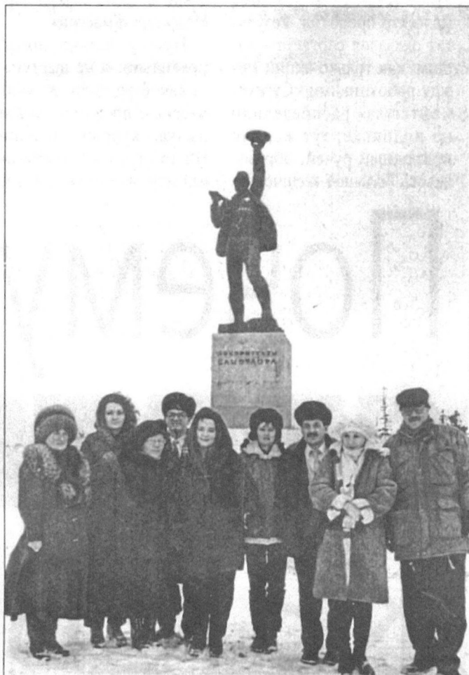
Сургутские журналисты у памятника Алеше (он же — Федор Митрусевич).

С городом нас знакомил экскурсовод, но нет нужды пересказывать историю Нижневартовска, об этом вы можете прочесть в книжках. В общих чертах — это обычный северный город, менее зеленый, чем Сургут, более компактный и «высокий» (много 16-этажных домов). Говорят, что как-то решили построить даже 20-этажное здание, но, хорошенько подумав, от проекта отказались — Нижневартовск стоит на болотах, мало ли что... Зато подземные пешеходные переходы в ближайшее время появятся. (Помните, как около года назад в Сургуте эту идею «зарубили», мотивируя тем, что в наших условиях подземные переходы построить невозможно.