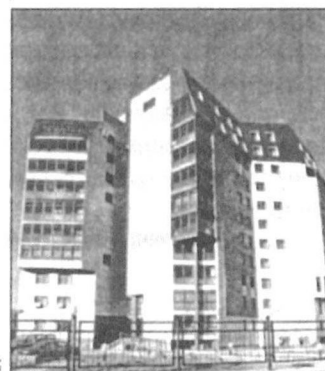
Жилой дом оригинальной формы, спроектированный зарубежными специалистами.

Обошел нас Нижневартовск в следующем: прямо в черте города — озеро, Комсомольское называется. Правда, жалуются горожане, что очень оно грязное, хоть чистят его коммунальщики понемногу каждый год. А надо бы «всем миром» на субботник выйти. Но общественность (в том числе комсомольцы) как-то не проявляет энтузиазма. Тут, бесспорно, есть чему