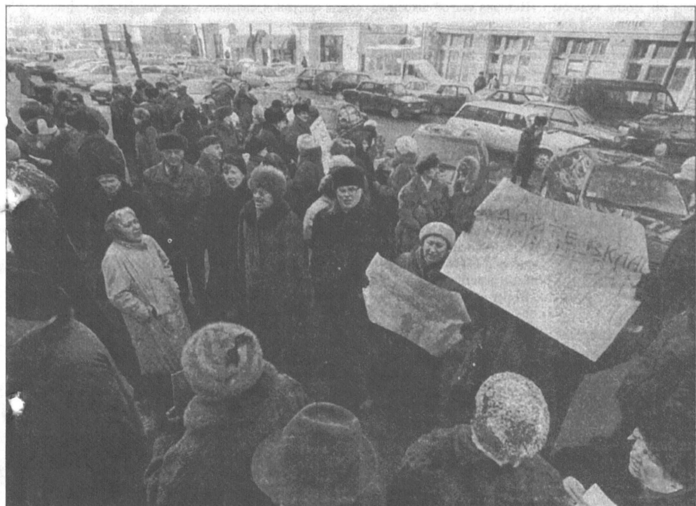
По словам представителя «Сургутнефтегаза», АО завалено тысячами заявлений акционеров. Правда, до ситуации, как в Москве, дело не дошло.

ницы, рубрики) для акционера. Если это всерьез, то хотелось бы поверить, что «воспитательный процесс» не ограничится «беглым просмотром годовых оценок в дневнике».