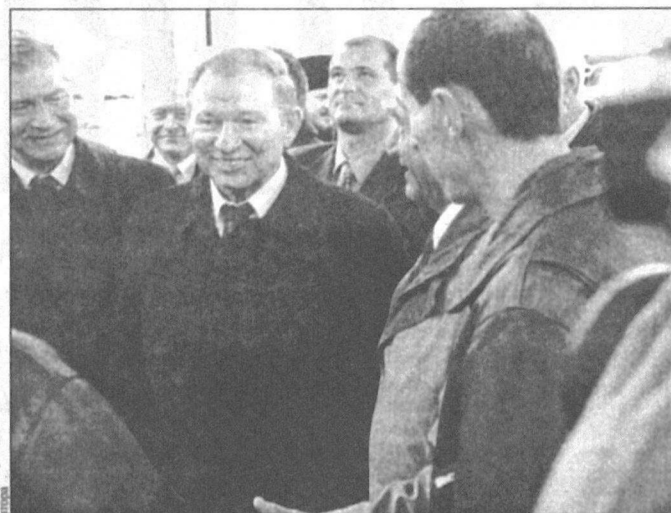
Останется ли Леонид Кучма президентом?

зрения». Почти все телеканалы и печатные СМИ на Украине работали и работают под полным или частичным влиянием президентской администрации. Так что в плане идеологии было все спокойно. А Леонид Кучма неоднократно с голубых экранов внушал народу главную заслугу действующей власти: «Слава Богу, у нас нет таких потрясений, как в России».