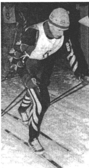
пит на чемпионате мира в Швейцарии.