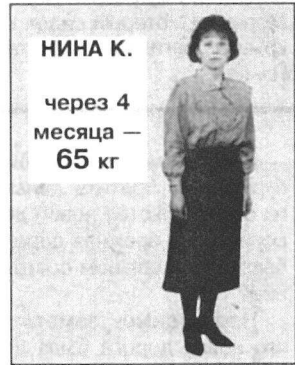
НИНА К. через 4 месяца — 65 кг