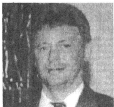
— Расскажите, пожалуйста, специалисты какого профиля есть в санатории?

— В санатории работают три терапевта, врач-педиатр, узкие специалисты — стоматолог-лечебник, физиотерапевт, врач-проктолог. Мы имеем возможность выполнять все виды функциональной диагностики — электрокардиографию, исследование кровеносных сосудов, проведение ультразвукового обследования. Проводится всевозможная консультативная помощь — невропатолога, лора, гинеколога, уролога, окулиста, хирурга. При необходимости специалистов, которых я не назвал, мы привлекаем для разовых консультаций.