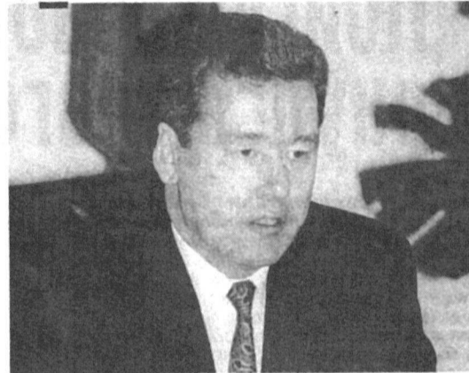
«В окончательном варианте принят целый ряд законо-

нов, — рассказывал он. — За прошедшее с начала года время они прошли несколько чтений, в них ликвидированы недоработки. Приняты законы о земле, о жилищной политике и распределении жилья в Ханты-Мансийском округе, о вахтовом методе, о реестре муниципальных должностей, о регистрационных сборах, взима-