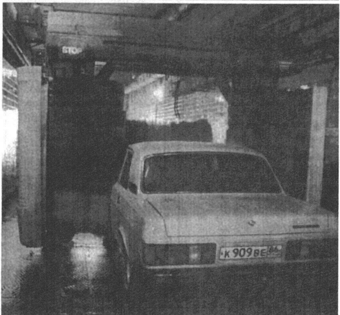
Самостоятельно вымыть авто, даже с использованием лучших моющих средств, можно, и эффект будет, правда, не самый лучший. Опытный автолю-

держание обходится слишком дорого, что, естественно, одними моечными услугами не окупается. Это отмечают практически все руководители автоцентров, в один голос заявляя, что клиентов сейчас почти нет. Летний сезон по праву можно назвать «мертвым». То есть не потому, что летом машины чище, просто люди не пользуются услугами автоцентров, считая, вероятно, это слишком дорогим удовольствием.