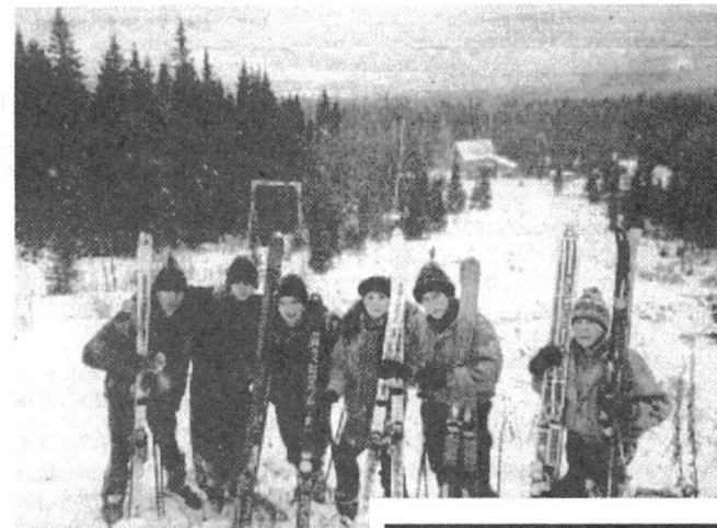
После первого выезда в горы, на Урал, у горнолыжного вида спорта появились первые горячие поклонники среди студентов Сургутского университета.

И это не удивительно. Трудно найти более красивое и увлекательное занятие зимой. Недаром люди во всех странах мира стремятся отдохнуть хотя бы раз в году на горнолыжных курортах.