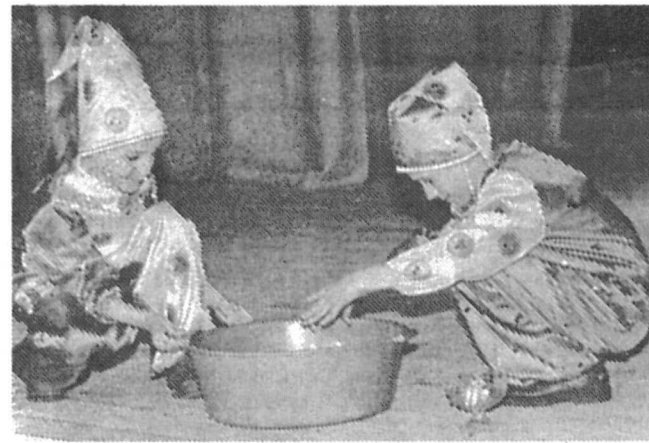
Татьяна СИЛИНА На снимке: на сцене юные таланты.

— не победа, а участие. Не было здесь ни победителей, ни побежденных. В этот день в «Строителе» царствовали улыбки и аплодисменты. И, может быть, чуть-чуть к радости примешивалась грусть — ведь день-то был прощальный, первая смена закончилась.