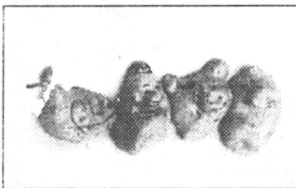
Поделки из картофеля: утка, король Лир, Винни-Пух, бегемот.