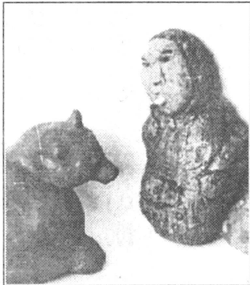
Два хозяина тайги, или медведь и курающийся ханты с рыбой.