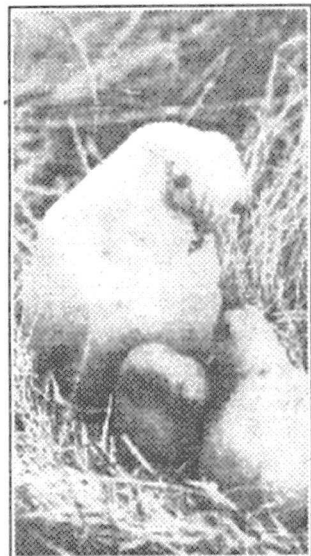
Гнездо чайки или чайка с птенцами.